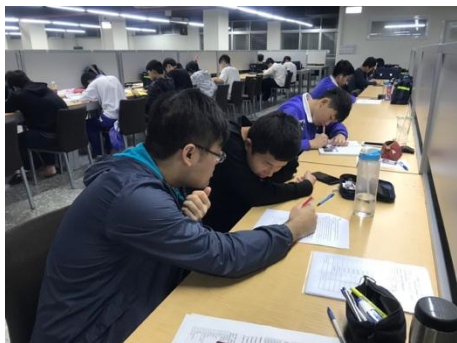
宿舍自修室課輔情形-2