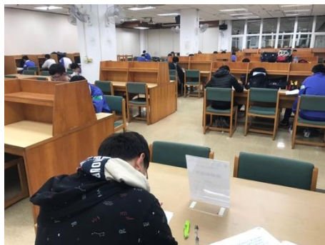
圖書館自修室課輔情形