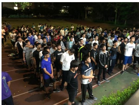
107年10月15日始業式-3 本校參與業自修之住宿生